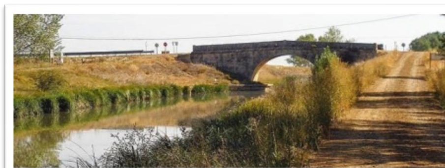
Puente de Bezana