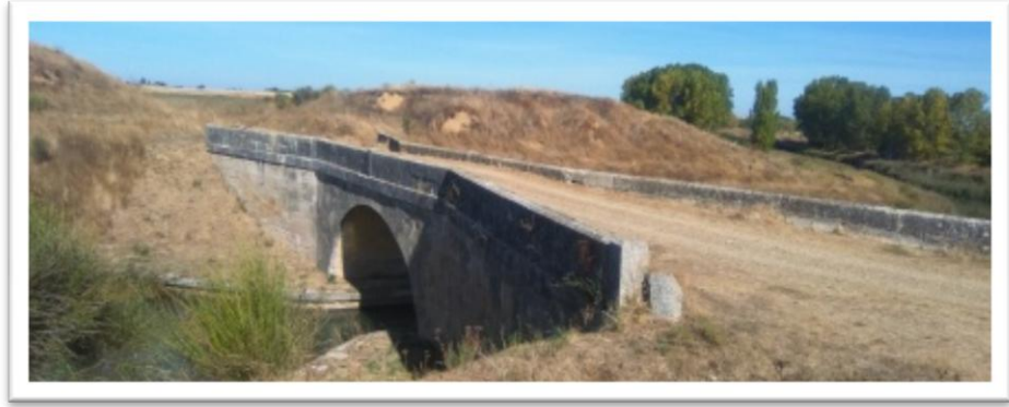
Puente El Gallo desde los caminos

El primero es el puente del Gallo que comunica caminos entre San Cebrián de Campos y Amusco