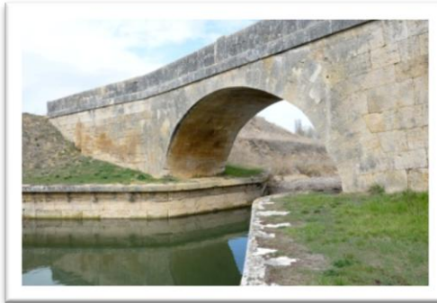
Puente El Gallo

En la construcción del Canal había que tener en cuenta no aislar los dos márgenes y nos encontramos con puentes.