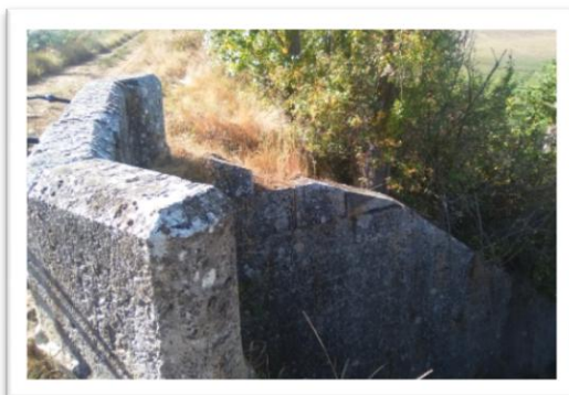
Paso de agua bajo el canal

Las infraestructuras son obras de ingeniería impresionantes para aquellos tiempos.